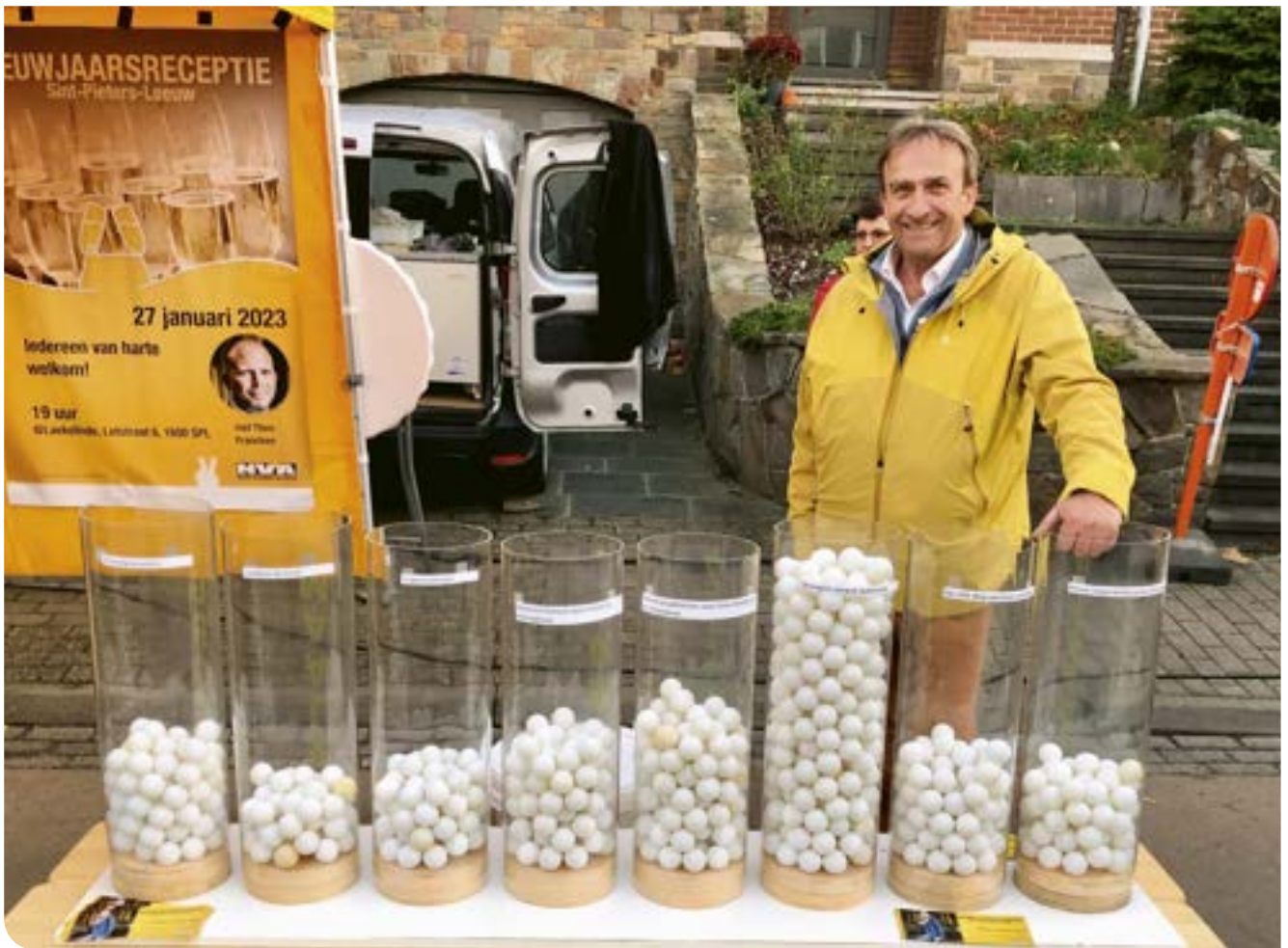
Tijdens de jaarmarkt in Sint-Pieters-Leeuw gaven de inwoners aan dat we blijvend moeten inzetten op de strijd tegen zwerfvuil.