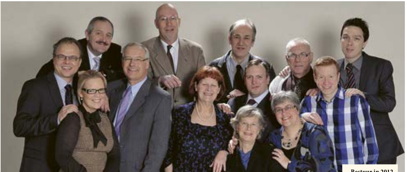
Bestuur in 2012